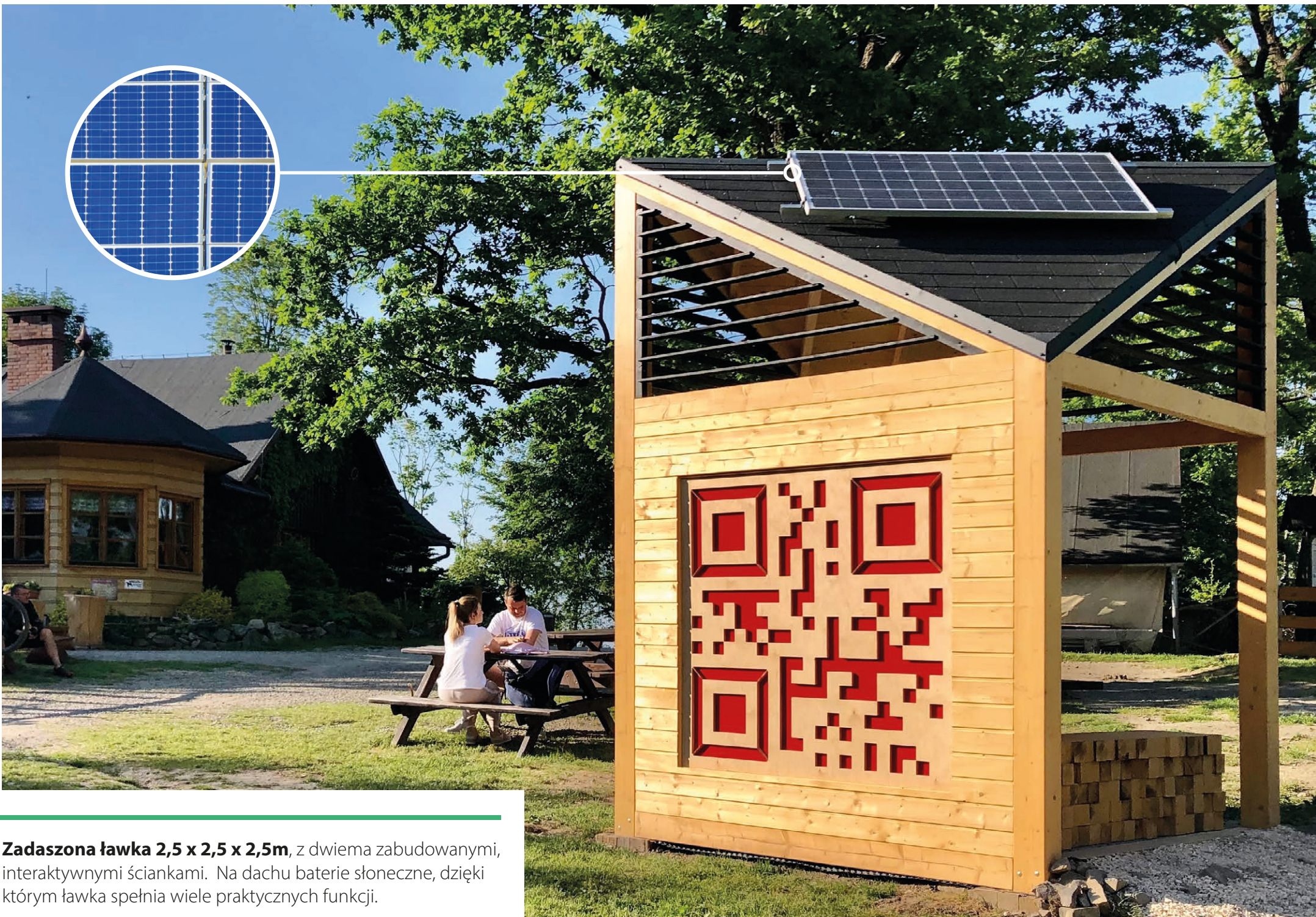
Zadaszona ławka 2,5 x 2,5 x 2,5m , z dwiema zabudowanymi, interaktywnymi ściankami. Na dachu baterie słoneczne, dzięki którym ławka spełnia wiele praktycznych funkcji.